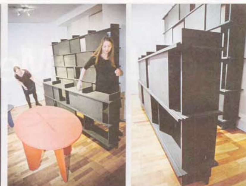
ENKELT OG STABILT: - Utgangspunktet for serien «Romfisk» var vårt eget ønske om enkle, stabile basismøbler som vi trenger; hyller, bord, vugger, sier sivilarkitektene.